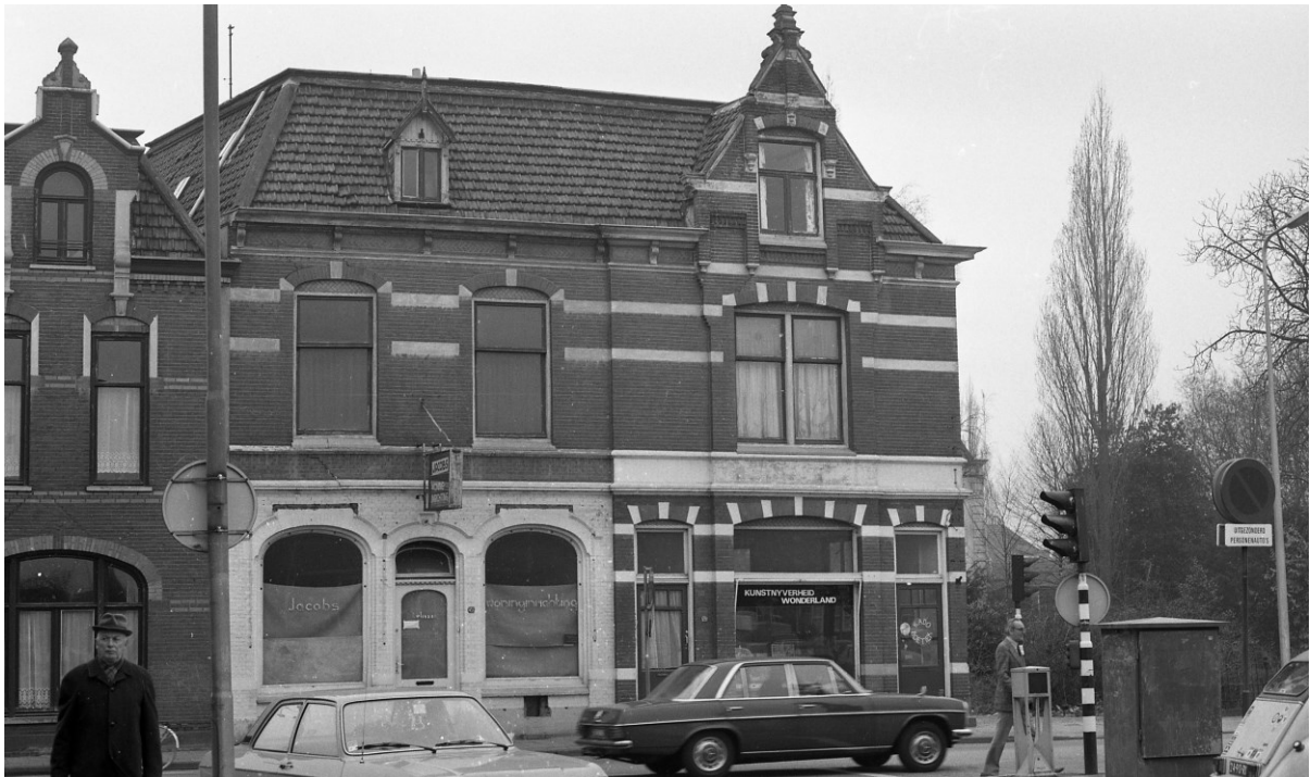
Brinklaan 48 en 50, gesloopt in 1984/85.