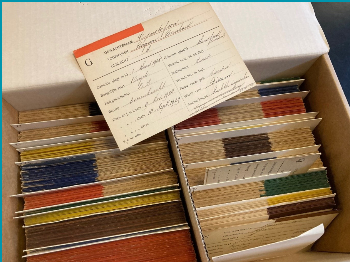
Dienstbodenregisters van de gemeente Muiden, 1924-1938 (SSAN019.03+694). In het afgelopen jaar gedigitaliseerd.