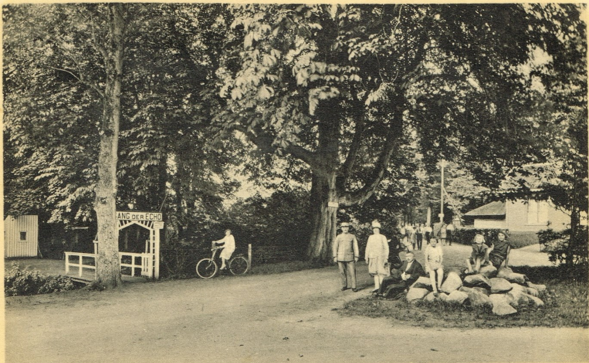
Muiderberg, Ingang "Echo".

Door de nauwere samenwerking met de collega's van het Streekarchief Gooi en Vechtstreek hebben we een beter beeld gekregen van de metadata in het gezamenlijke archiefbeheersysteem. Er is een start gemaakt met het opschonen en uniformeren van deze metadata, waarbij in de eerste plaats is gekeken naar de velden met dateringen en openbaarheidsbeperkingen. Medewerkers van beide archiefdiensten werken toe naar een uniforme werkwijze in het systeem.