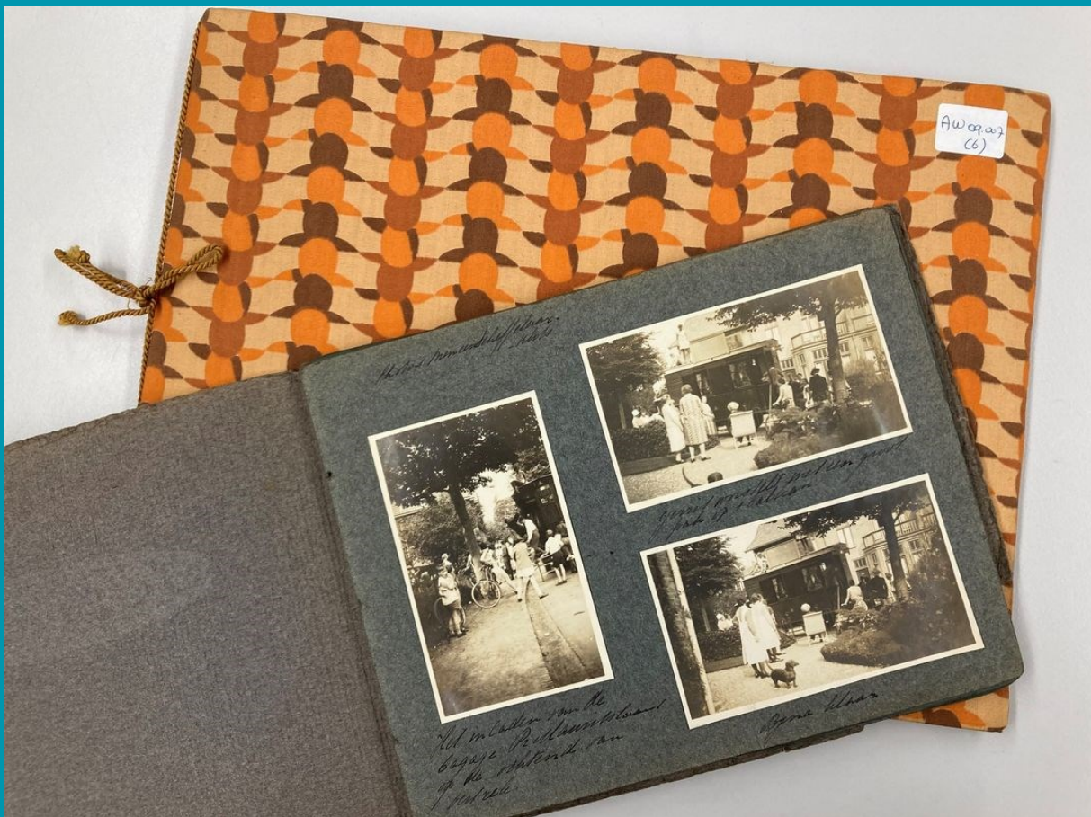
Fotoalbums uit het archief van de familie Mörzer Bruyns uit Bussum (SSAN109). In het afgelopen jaar gebruikt voor de sociale mediakanalen.

Een aandachtspunt is het informatiebeheer na implementatie van de fusie. De migratie van zowel het pre-depot als het werkarchief van Gemeentearchief Goose Meren en Huizen naar de digitale omgeving van Hilversum is inmiddels succesvol verlopen. Waardering en selectie dient nog plaats te vinden. Het digitale te bewaren archief zal in het e-depot worden opgenomen.