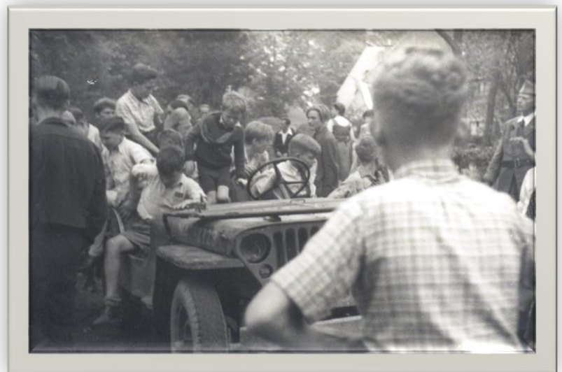
De Bussumse jeugd op een Canadese legerjeep