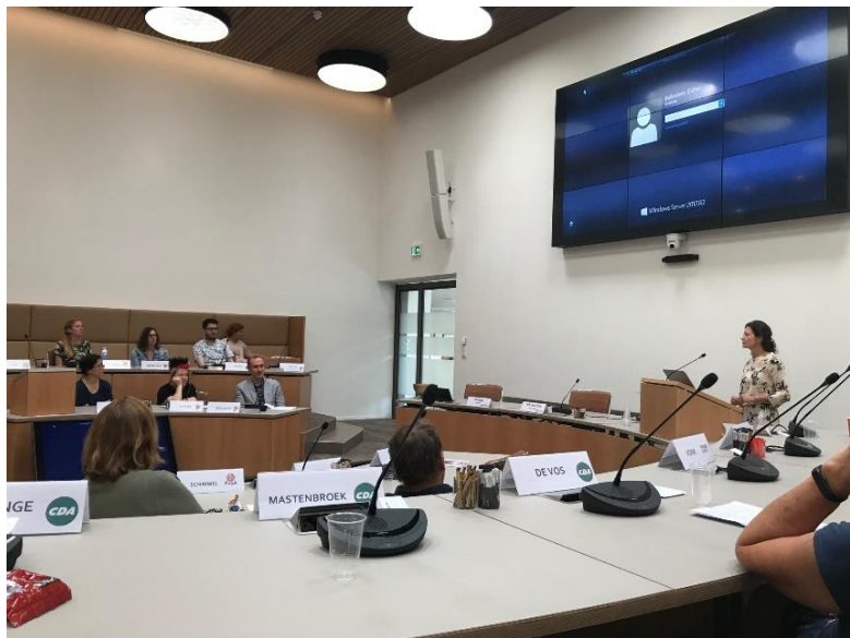
DIV-bijeenkomst in de raadszaal van Gooise Meren

Samen met het Streekarchief te Hilversum, Archief Eemland, het Regionaal Historisch Centrum Vecht en Venen en het Regionaal Historisch Centrum Zuidoost Utrecht werd in juli 2019 een kennismiddag voor DIV-medewerkers georganiseerd. Deze 6e kennismiddag van dit samenwerkingsverband thematiseerde diverse ontwikkelingen die het informatiebeheer beïnvloeden, zoals de invoering van het Digitaal Stelsel Omgevingswet en audits op basis van het Kwaliteitssysteem Informatiebeheer Decentrale Overheden. Normaal gesproken is Amersfoort de plaats van samenkomst, ditmaal werd de bijeenkomst belegd in de raadszaal van Gooise Meren.