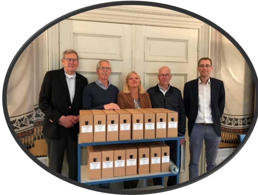
Bestuursleden, vrijwilligers en archivaris

fietspaden in de regio. De vereniging was de laatste in haar soort. In andere regio's was de vereniging al eerder ter ziele gegaan. Een van de wapenfeiten van de vereniging is de beroemde ANWB-paddenstoel. Het deel van het archief dat al bij ons stond was nooit goed 'doorgelicht': het wemelde van dubbele exemplaren, overbodige stukken als oude facturen etc. Een vrijwilliger heeft dit archief onder begeleiding van een collega integraal doorgenomen en bewerkt. Er staat nu 2 meter keurig geordend archief op de plank. Op maandagochtend 30 september 2019 heeft een feestelijke overdracht plaatsgevonden.