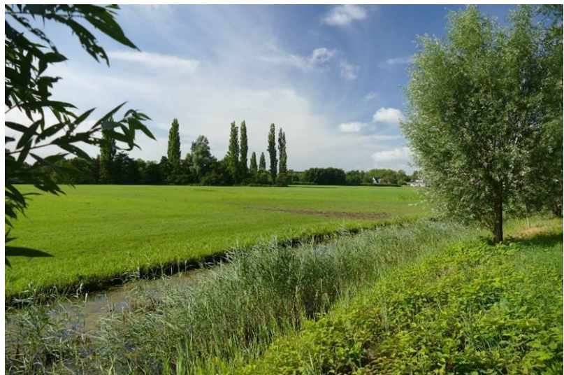
Zanderijlandschap bij de Abri, Naarden