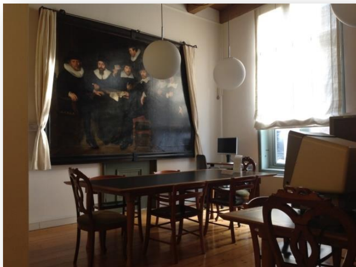
Studiezaal in het oude Burgerweeshuis

Het gemeentearchief stelt de historische archieven beschikbaar aan het publiek via de studiezaal aan de Cattenhagestraat en via de website. De studiezaal is een historische werkplaats voor mensen die dieper willen graven.